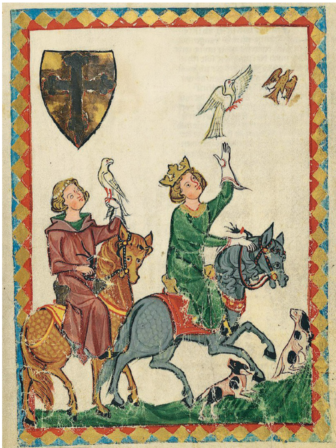
Dinastia di re Corrado IV Hohenstaufen nel Codex Manesse della Biblioteca universitaria di Heidelberg